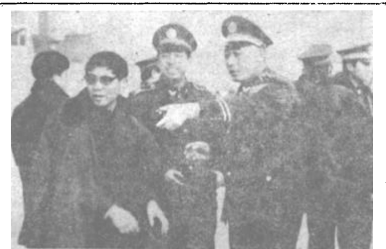
市公安局交警支队认真做好人、车、路的综合治理，取得显著的效果。今年一至三月份、死亡人数比去年同期有了大幅度下降。（王维亭）

二是进一步贯彻实施《标准化法》，做好标准化工作。进一步加强《标准化法》及其配套法规的贯彻实施；对于强制执行的标准，要认真监督，对违法者要依法查处；继续做好企业产品标准备案工作。三是全面实施《计量法》，继续做好计量工作。抓好强检工作；强化商贸计量监督；抓好土地面积计量单位试点和企业计量工作。四是努力为发展外向型经济服务。对合资、三资和有出口产品的企业，在检定、测试、咨询等方面要优先安排；对引进的技术设备的技术鉴定、标准化、计量审查等工作 随时随到。（本报记者）