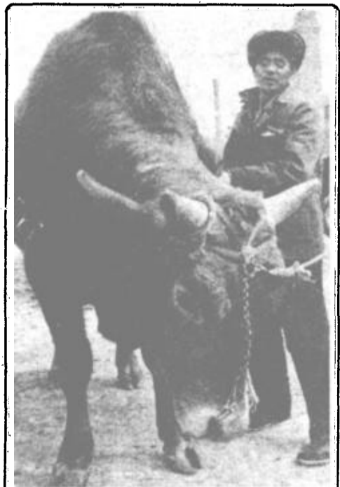
曾连续二年获市畜牧业冠军的广饶县陈官乡，把大牲畜饲养纳入科学化、规范化轨道。乡里成立了良种场，引进良种牛，统一配种繁殖，取得了良好的经济效益。

利津讯 为活跃流通，支持生产，方便社会各界的资金使用，我市第一家县区级典当拍卖行——利津典当拍卖行日前开业。这个由利津县农业银行组建的典当行为城乡居民办理首饰珠宝家用电器等各类物品的典当并在死后负责拍卖。方便了群众，也促进了资金的灵活流通。（刘利华）