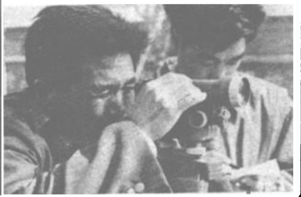
路养护工作已有30个春秋，他把全部心血和汗水倾注到了公路建设上，连年被评为先进工作者，去年被市政府授予劳动模范称号。

本报讯 (记者陈谨之 通讯员王雪锋)广饶县大王建安总公司电子设备厂研制成功的能对各种液体进行交变电磁场磁化的装置——CH系列交变电磁场磁化机，日前通过技术鉴定。专家们一致认为，这项成果属国内首创。