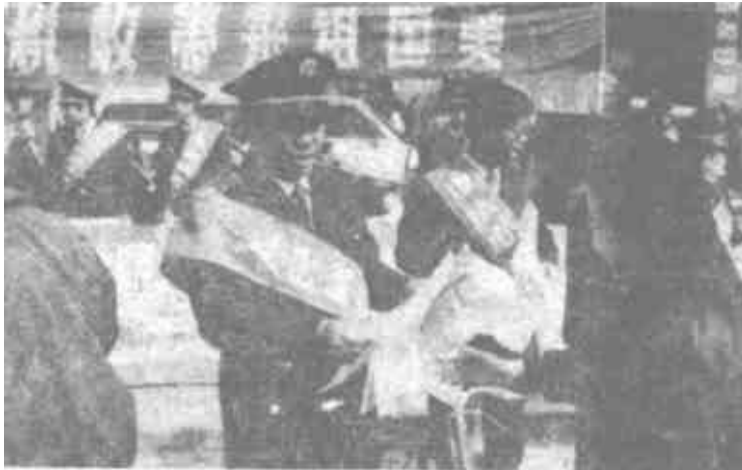
4月4日，市税务局组织了40余人的税务干部走上街头，开展税法宣传月活动。他们利用咨询台，宣传车，向公民宣传纳税业务。

通知要求，各县、区委宣传部，各县区普法工作领导小组，市直各部门、各大专院校、各企事业单位，要明确学习、宣传、贯彻《国家安全法》的指导思想。要以十四大精神为指针，紧密结合改革开放的新形势，深刻领会精神实质，全面掌握法律条文，进一步增强全体公民的法制观念和国家安全意识，为顺利开展国家安全工作，有效地防范、制止和打击危害国家安全的行为创造良好的法制环境和舆论环境；要发挥报刊、广播、电视等舆论工具的作用，造成一定的声势。各单位应根据自己的实际，利用开辟报刊专栏、办短训班、知识竞赛、黑板报、宣传栏等多种形式，扩大宣传广度和深度；要突出学习宣传贯彻国家安全立法的必要性和重要意义、《国家安全法》的调整对象及危害国家安全行为的种类，法律规定的公民和组织维护国家安全的义务和权利；危害国家安全行为所应承担的法律责任等内容；要把《国家安全法》的学习、宣传同普法教育紧密结合起来。各级普法主管部门要把《国家安全法》的学习、宣传、教育活动作为普法教育的重要内容，切实抓紧抓好；各单位、各部门要认真组织，加强领导。宣传部门要组织协调好各新闻单位的舆论宣传工作，普法部门要积极主动地做好工作，把《国家安全法》的学习搞得扎实有效。（本报记者）